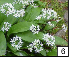
Allium ursinum Czosnek niedźwiedzi