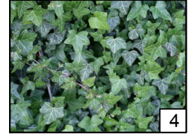
Hedera helix Bluszcz pospolity