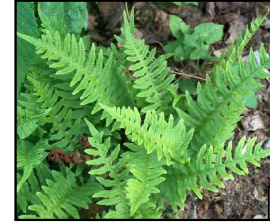
Polypodium vulgare Paprotka zwyczajna