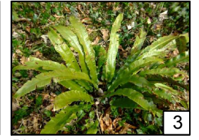
Phyllitis scolopendrium Jęczyznik zwyczajny