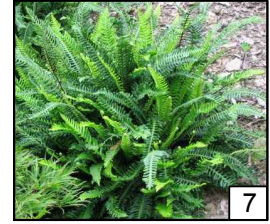
Blechnum spicant Podrzeń żebrowiec