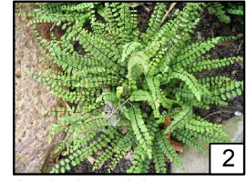
Asplenium trichomanes Zanokcica skalna