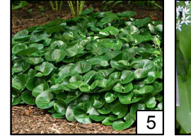
Asarum europaeum Kopytnik pospolity